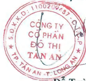
Đỗ Tường Y